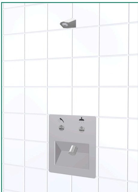
Bilden visar WS38981